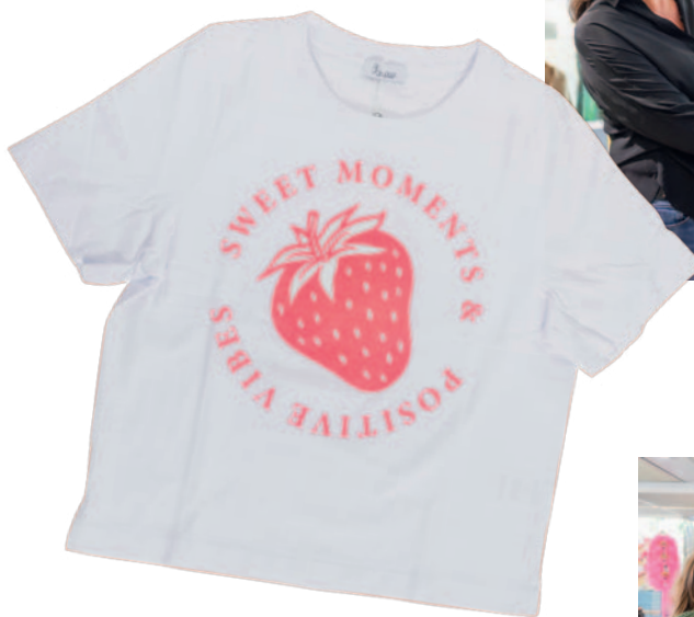
T-Shirt Marke: Princess Preis: CHF 89.-