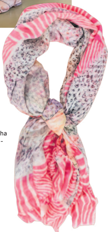
Schal Marke: Mala Alisha Preis: CHF 139.-