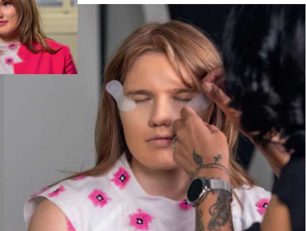
Make-up: Duygu Igsiz, Swiss Beauty & Coiffeur Mireda